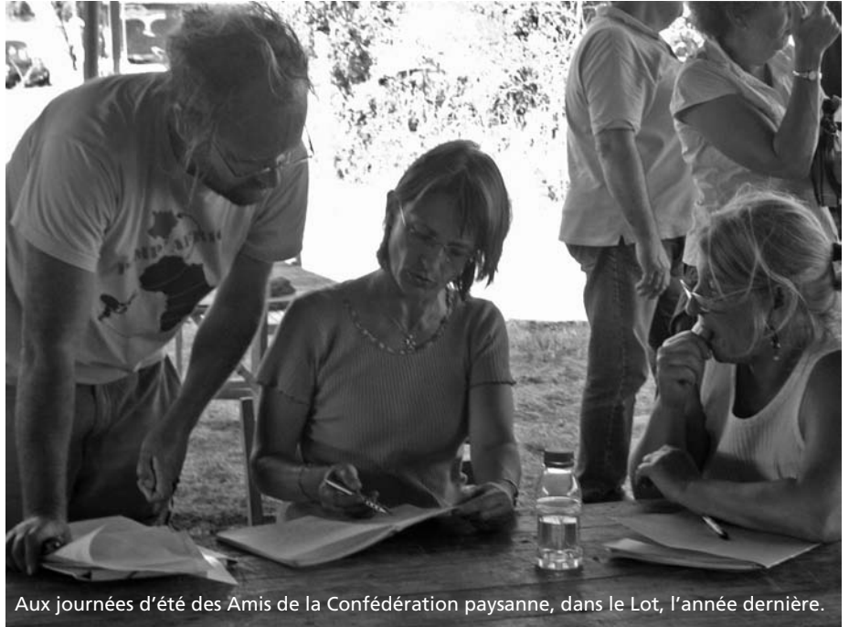
Aux journées d'été des Amis de la Confédération paysanne, dans le Lot, l'année dernière.

Les Amis de la Conf' vont aller à la rencontre des paysans confédérés et des