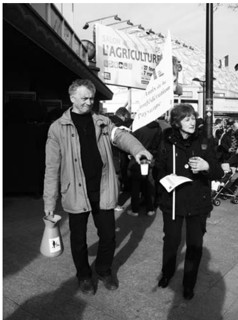
Distribution de lait aux visiteurs du Salon de l'Agriculture 2010, à Paris. Les Amis de la Confédération paysanne étaient à nouveau aux côtés des militants paysans.

Héritages écologiques et sociaux complexes, ces situations ne s'abstraient pas de l'environnement immédiat, planétaire et stratosphérique, comme l'ont bien mis en évidence les constats sur l'évolution climatique.