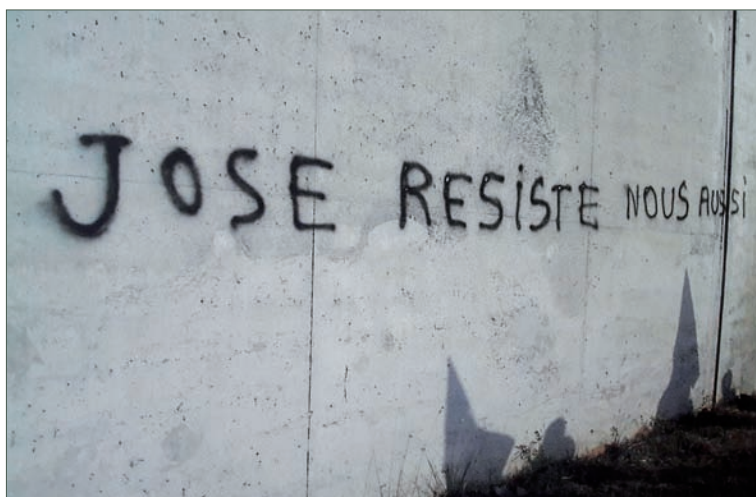
Sur les murs de la prison de Villeneuve-lès-Maguelone, près de Montpellier. En juin 2003, José Bové y sera incarcéré six semaines après avoir été jugé et condamné pour avoir participé, en tant que porte-parole de la Confédération paysanne, à des actions de neutralisation d'OGM. Le combat, long, sera toutefois victorieux.