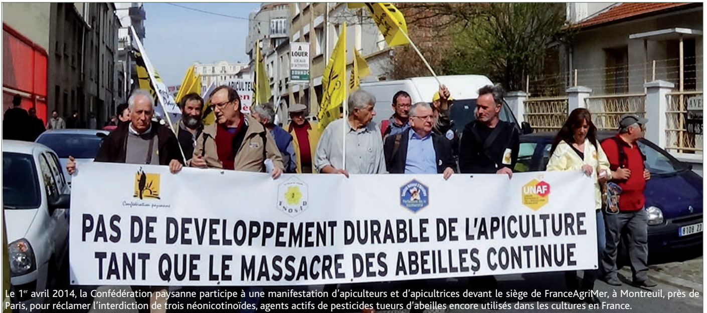
Le 1 er avril 2014, la Confédération paysanne participe à une manifestation d'apiculteurs et d'apicultrices devant le siège de FranceAgriMer, à Montreuil, près de Paris, pour réclamer l'interdiction de trois néonicotinoïdes, agents actifs de pesticides tueurs d'abeilles encore utilisés dans les cultures en France.