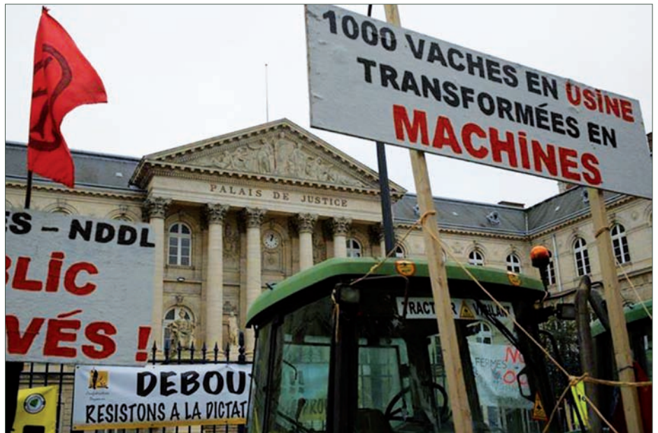
À Amiens, le 28 octobre 2014, lors du procès de 9 militantes et militants de la Confédération paysanne poursuivis pour avoir participé à des actions dénonçant le projet de ferme-usine des 1000 vaches à Dru-cat (Somme). Toutes les actions contre les fermes-usines ne sont pas immédiatement victorieuses mais toutes ont freiné leur développement en France en mobilisant de nombreux acteurs de la société aux côtés des paysannes et des paysans.

Les liens tissés au sein de la Coordination paysanne européenne (1) avec son homologue allemand AbL permettent aux militants de la Conf' d'en savoir plus sur les élevages de cet industriel : surconcentration, forte mortalité des animaux, pollutions, conditions de travail déplorables pour les employés, nuisances pour les riverains. Suite à la projection en février 1992 d'un documentaire sur ces réalités, un comité d'opposition au projet Pohlmann se crée et lance une pétition. En mai 1993, la Confédération paysanne organise une marche baptisée « Pohlmann-Bruxelles » dans le but d'interpeller la Commission