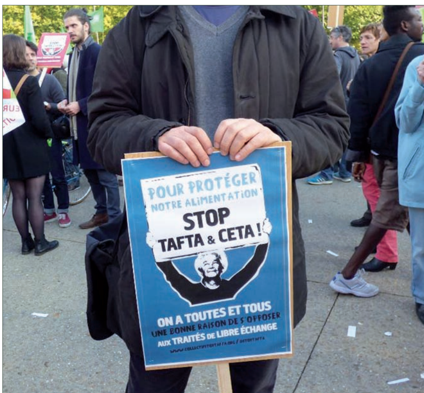
La Confédération paysanne participe aux actions du collectif d'organisations politiques, syndicales et associatives contre le Tafta et le Ceta, projets d'accords de libre-échange entre l'Union européenne et les États-Unis ou le Canada.

maïs transgénique est repéré. S'en suit une mobilisation d'un mois qui fait chaque jour la « une » du Dauphiné Libéré , entraînant la population locale jusqu'au festival